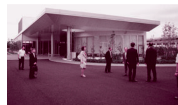
泉大津市斎場での調査