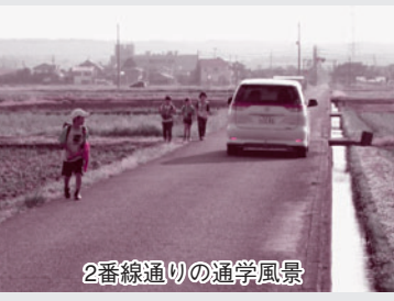
2番線通りの通学風景

A 約74%の28項目について、おおむね順調に実施されています。課題は、メモリアルパークへの対応であり、今後方針を示していく必要があると考えています。