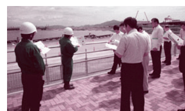
中国電力福山太陽光発電所での調査