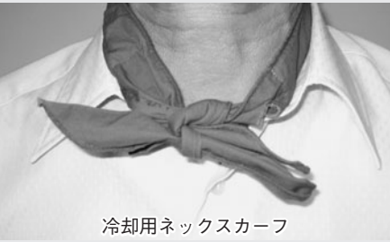
冷却用ネックスカーフ

A 行の生ごみ処理機等の助成について一層の周知を図り、分別意識の定着を図ることが必要と考えており、現時点ではバイオマス事業は考えていません。