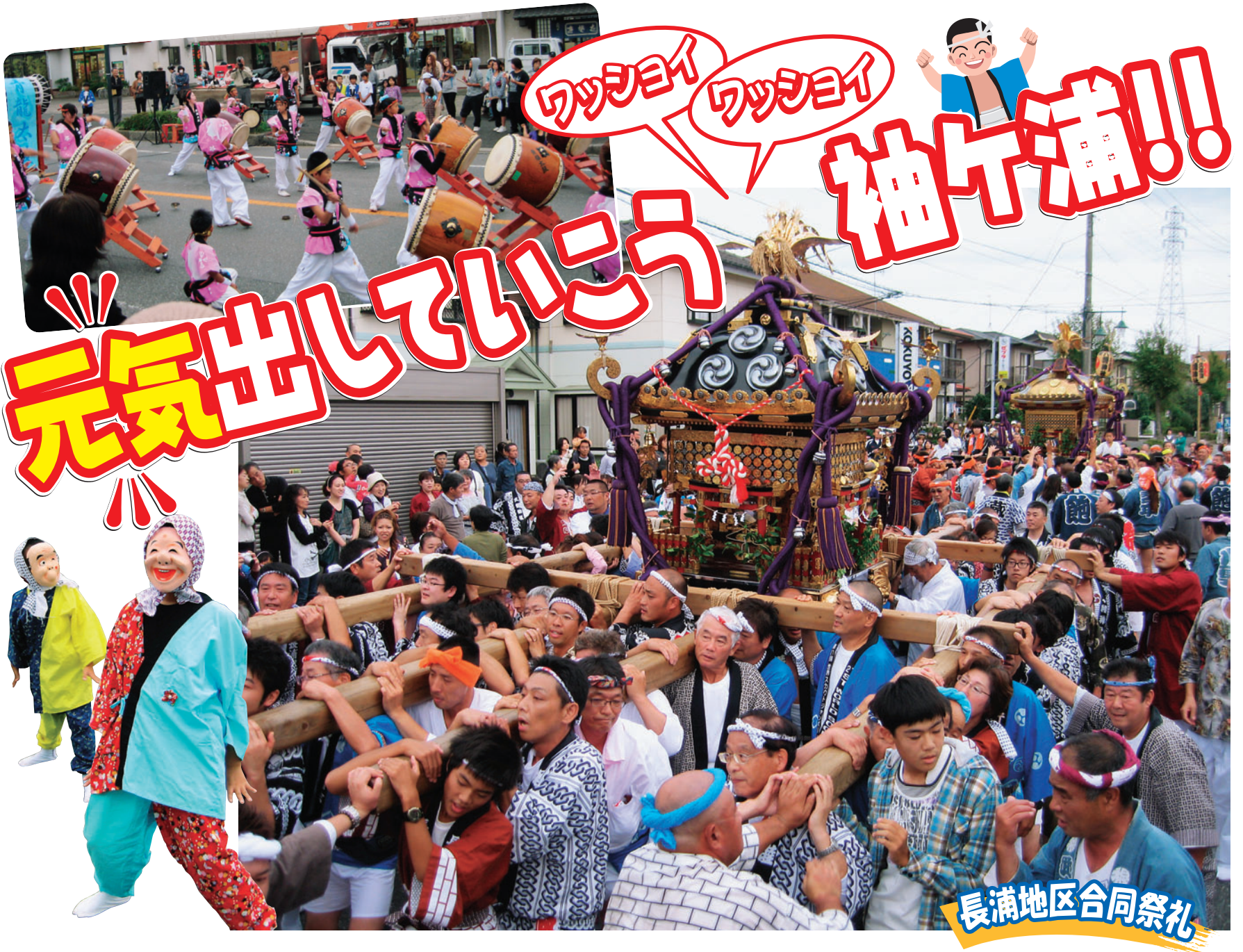
長浦地区合同祭礼

発行/袖ヶ浦市議会 編集/議会広報特別委員会 〒299-0292 千葉県袖ヶ浦市坂戸市場1-1 ☎0438 (62) 2111 (代)