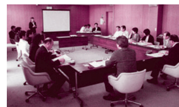
北上市役所での調査