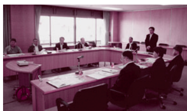
流山市役所での調査