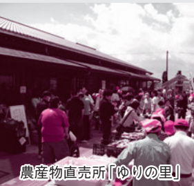
農産物直売所「ゆりの里」