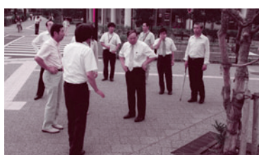
藤沢市辻堂駅前での調査