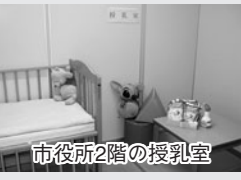
市役所2階の授乳室